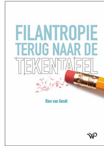
Filantropie terug naar de tekentafel verschijnt op 26 oktober bij Walburg Pers. Prijs € 34,99

Hoe zou de verhouding tussen al die verschillende partijen – overheid, politiek, fondsen – dan volgens u moeten zijn? 'Ook vanuit uw ervaring als bestuurder van Samenwerkende Brancheorganisaties Filantropie (SBF)?' 'Daar kun je op verschillende manieren naar kijken. Ten eerste: de overheid in de rol van regelgever, waarbij ze een klimaat schept dat stimulerend is voor fondsen. Daarin zijn nog slagen te maken, zeker als je kijkt naar de Verenigde Staten en de rest van Europa. In mijn ogen loopt de Nederlandse overheid soms achter bij de behoefte van de sector. Ook inhoudelijk zou de overheid beter kunnen samenwerken met de fondsenwereld. De overheid ziet taken op zich af komen, die vaak te groot zijn om aan te pakken. Dat geldt op nationaal en lokaal niveau, maar ook op het niveau van de Europese Commissie. Met de steeds groter wordende complexe mondiale problemen op het gebied van klimaat, armoede en ongelijkheid, is privaat geld voor het publieke doel heel belangrijk. Als je dat echt in wilt zetten, moet je de fondsen niet alleen maar zien als een pinautomaat waar aan het eind van de dag geld uitkomt om het budget-